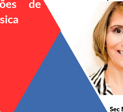
Zélia Vasconcelos Sec Mun de Educação Petrolina