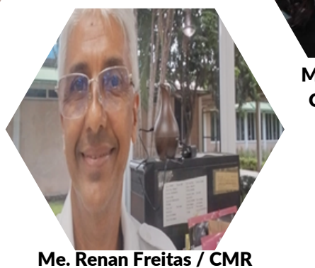
Me. Renan Freitas / CMR