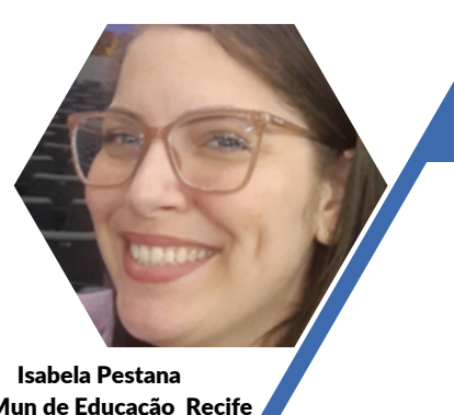
Isabela Pestana Sec Mun de Educação Recife