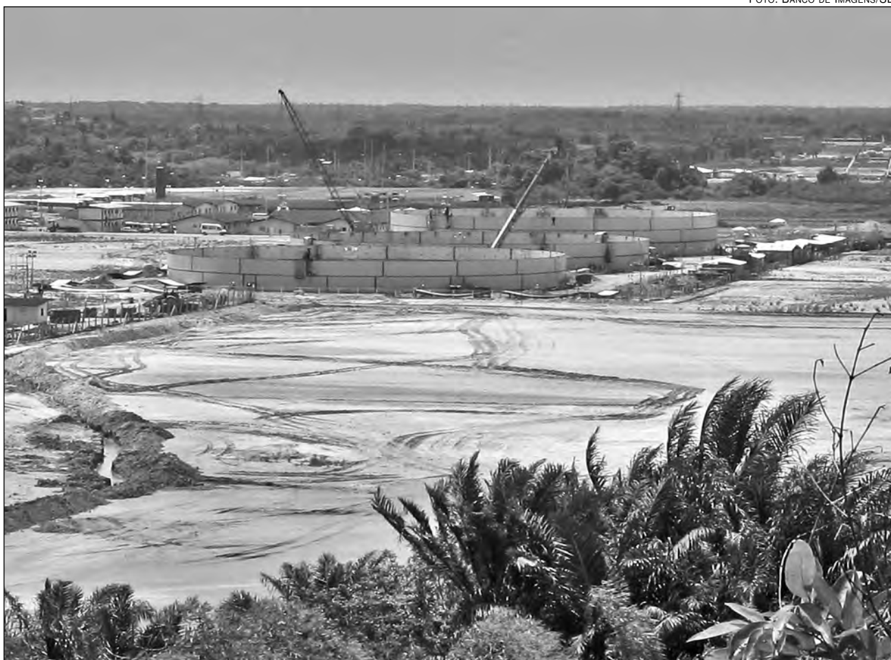
REINDUSTRIALIZAÇÃO do Estado é apontada como fator de redução do desemprego e aumento da renda do trabalhador em PE

A pesquisa aponta ainda como destaque o crescimento do rendimento médio do trabalhador. Novamente, a capital pernambucana aparece no topo da lista, desta vez com o maior crescimento da média salarial (12,5%), na comparação com o mesmo mês de 2011. Em setembro, o rendimento médio do pernambucano ficou em R$ 1.301,60, contra o salário de R$ 1.157,35 registrado em 2011.