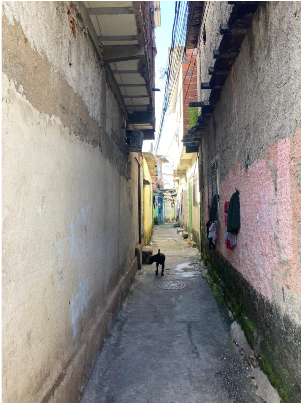
Título : Vial na Comunidade de Santo Amaro ; Técnica fotográfica e equipamentos utilizados: Regra dos terços, Moto G One Fusion.