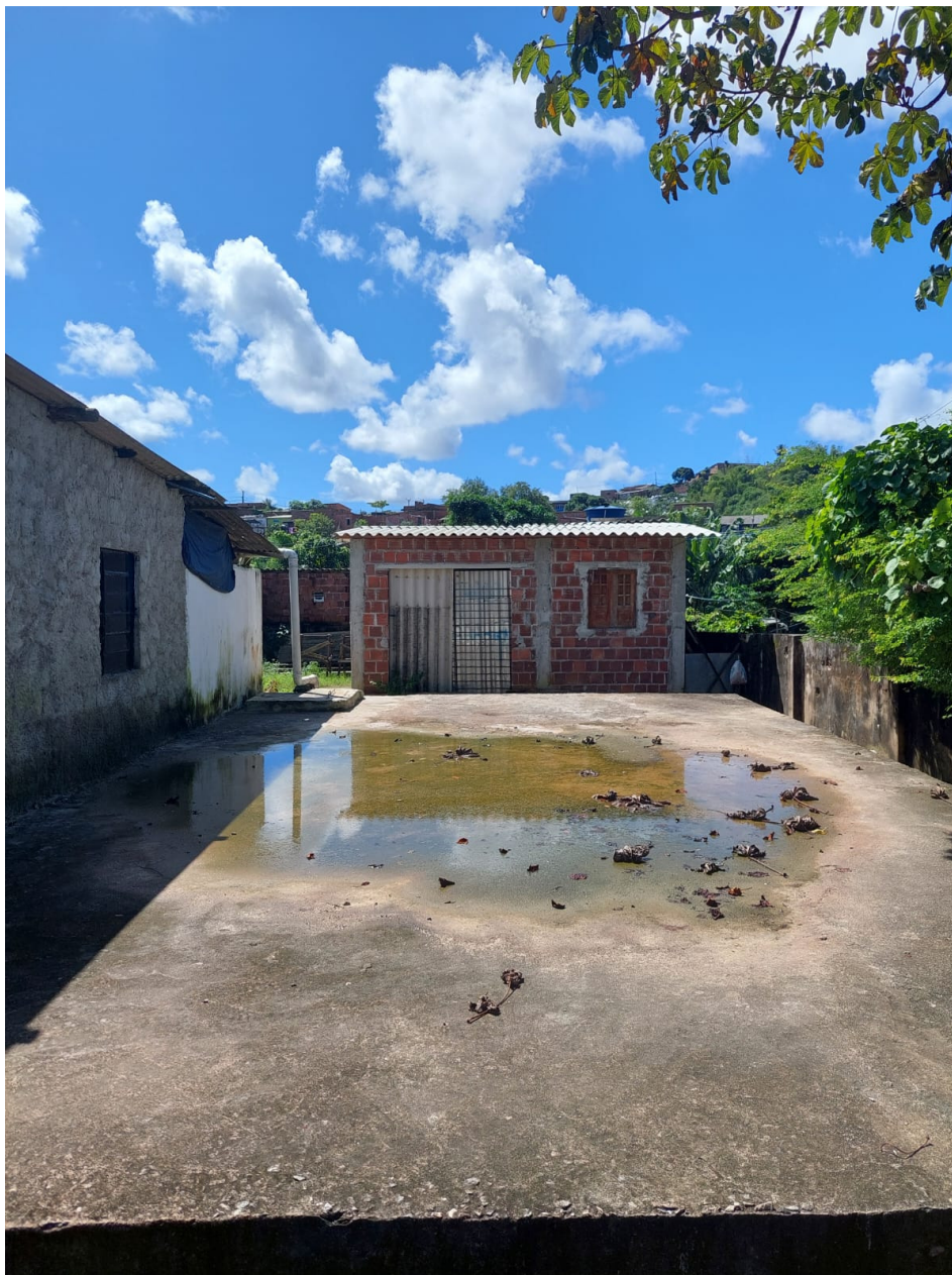
Título : Modesta residência da comunidade Vila Independência ; Técnica fotográfica e equipamentos utilizados: Enquadramento regra dos terços. Samsung A72.