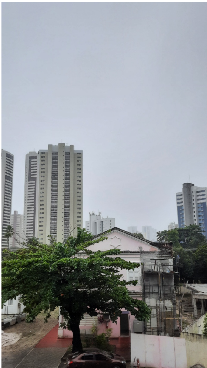
Título : Do Caos a Evolução , Técnica fotográfica e equipamentos utilizados : Samsung SM-M315F .